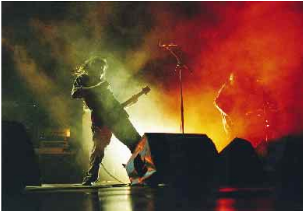
Seven Hate en concert au château d'Oiron, invité vedette des Lycéades et Tremplins musicaux.