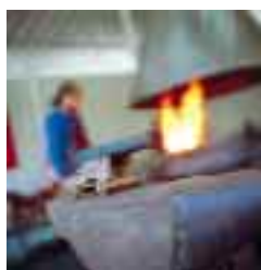
Ci-dessus, le chantier de l'Hermione à Rochefort et la chaudronnerie.