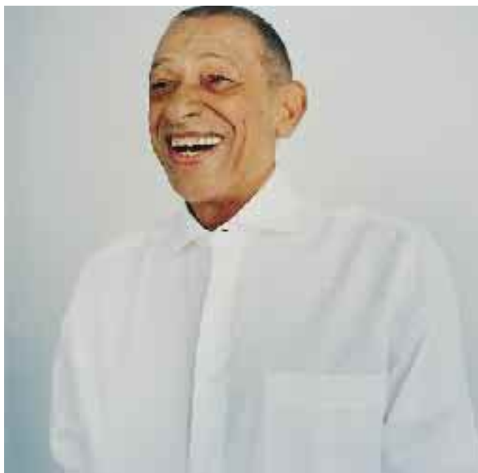
Henri Salvador en concert le 18 juillet à La Rochelle.