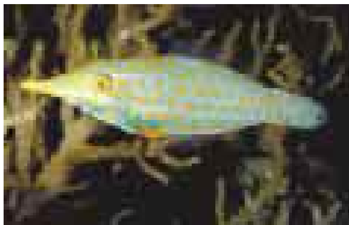
Lime à taches oranges à l'aquarium de La Rochelle.

Une cinquantaine de créations du maître verrier Jean Mauret sont exposées au musée du vitrail de Curzay-sur-Vonne jusqu'en mars 2002. Maquettes, cartons, sculptures, xylographies et vitraux transmettent la philosophie d'un artiste qui, selon ses termes, «ne crée pas véritablement et qui n'a la possibilité que de former, à partir de ce qui existe déjà.» La démarche qu'il a adoptée depuis de nombreuses années aboutit à une œuvre globale en accord avec l'architecture des lieux, créant une harmonie entre l'artiste, la matière, la lumière et le divin. www.museeduvitrail.com Tél. 05 49 53 65 45