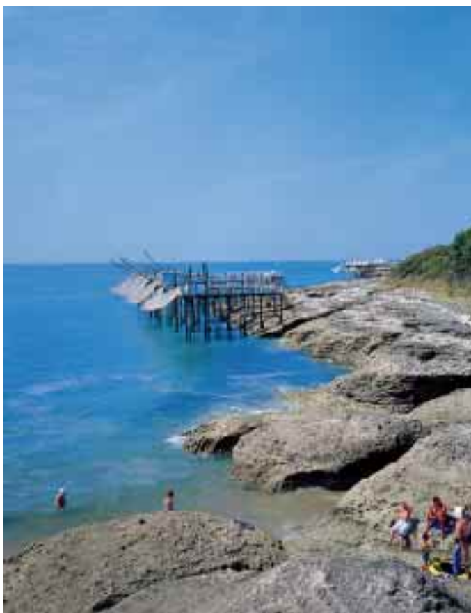
La grande côte à Saint-Palais, ph. Sébastien Laval.