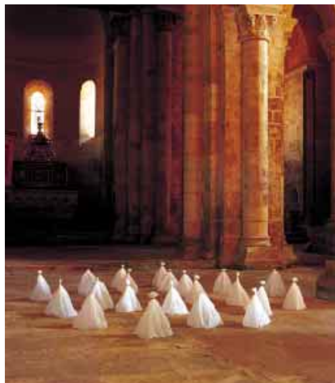
Michel Blazy, sans titre (derviches tourneurs), 1993, Frac Poitou-Charentes.