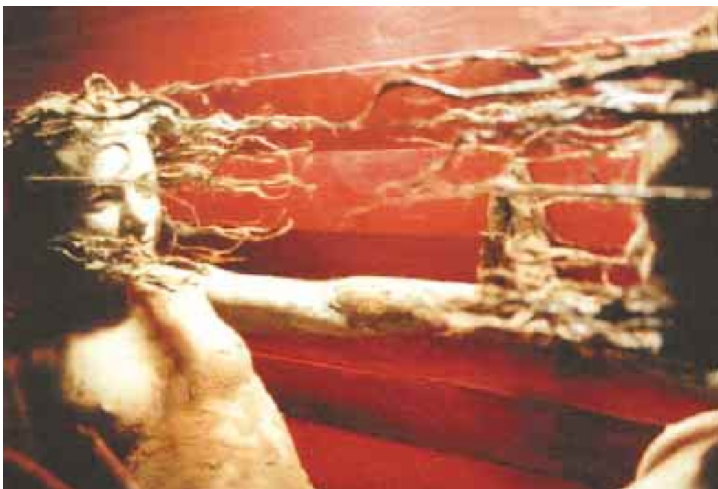
Le Golem à Parthenay le 22 août.

Chaque été, la Médiathèque François-Mitterrand propose de découvrir une partie de ses collections patrimoniales. Cette année, l'exposition entend dresser un panorama des représentations cartographiques du Poitou sous l'Ancien Régime, s'intéressant aussi bien au travail des ingénieurs topographes qu'à celui des graveurs. Du 17 juillet au 15 septembre.